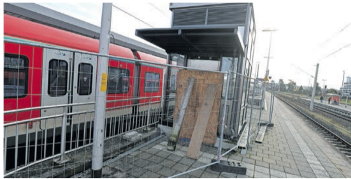
Es soll bald vorangehen auf der Aufzugsbaustelle an Gleis 2.

Der FDP-Fraktionsvorsitzende Tobias Kruger wählte in der letzten Sitzung der Stadtverordnetenversammlung in diesem Jahr deutliche Worte: „Es ist eine Sauerei, was die Deutsche Bahn hier macht“, meinte Kruger mit Blick auf die Situation an Gleis 2. Dort kann der defekte Aufzug seit fast einem Jahr, wahrscheinlich auch schon länger, nicht benutzt werden. Die Situation sei nach wie vor eine Katastrophe für Menschen mit Bewegungseinschränkungen. In der Werbung werde das Thema Barrierefreiheit immer groß bespielt, kritisierte Kruger, während vor Ort seit Monaten ein Bahnsteig für Menschen mit Bewegungseinschränkungen nicht nutzbar sei. In ihrem Antrag forderten die Liberalen unter anderem,