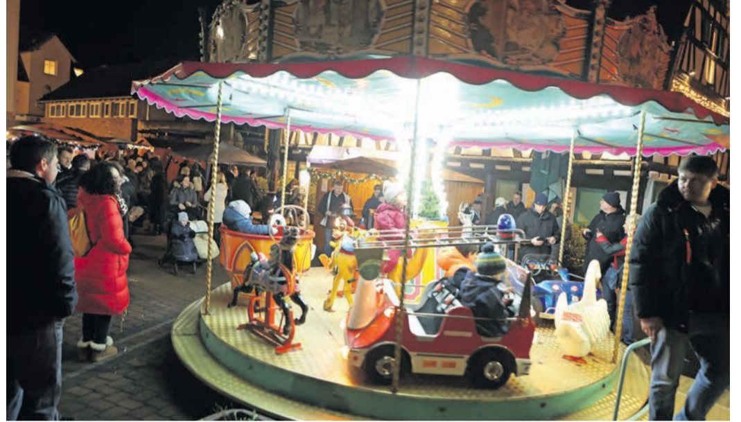
Große und kleine Besucher genossen am zweiten Adventswochenende den Urberacher Nikolausmarkt.

Nach den kurzen Eröffnungsworten gab der Musikverein 06 Urberach am Samstag ein kleines Platzkonzert und machte