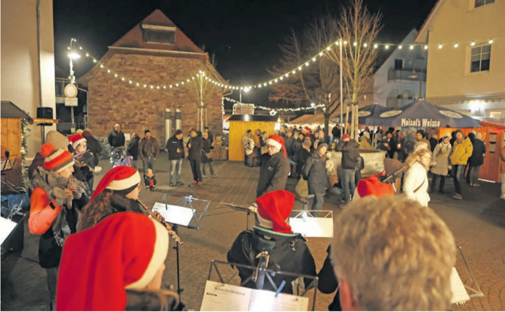
Der Musikverein 06 gab am Samstag ein Platzkonzert.

Urberach (PS) - Regen gab es nur am Samstagmorgen, bis zum Start des Urberacher Nikolausmarktes war trockenes Adventswetter eingekehrt. So herrschte am Wochenende bei der Tra-