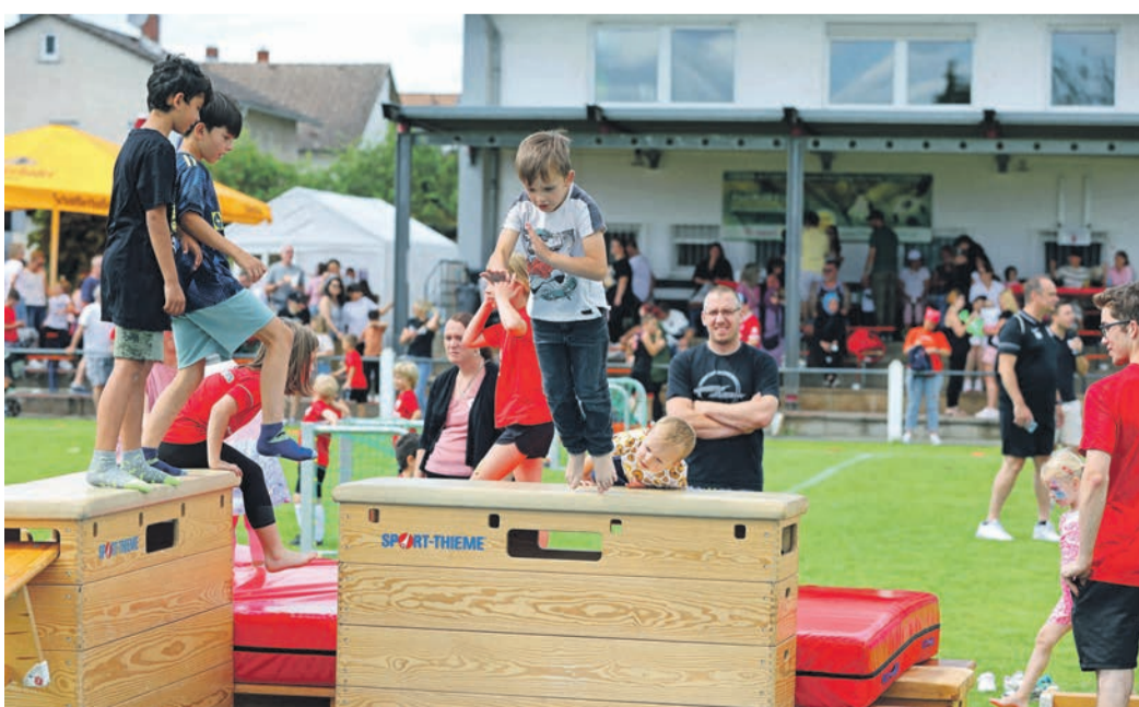
Die Mitmachstationen wurden vor allem von den jungen Besuchern genutzt.

Noch bis zum Sonntag läuft die 48. Auflage des Rödermark-Fußball-Turniers, am Freitag öffnet zudem der TS-Sommergarten, der bis zum 4. August dauert.