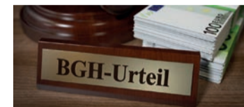
Starkes Urteil für Versicherte.

sind viele Versicherungsverträge auch heute noch anfechtbar. Man nennt dies „ewiges Widerrufsrecht“. Bei einem Widerruf erhalten Sie, anders als bei der Kündigung, alle eingezahlten Beiträge ohne Abzug von Maklerprovisionen und Verwaltungskosten zurück.