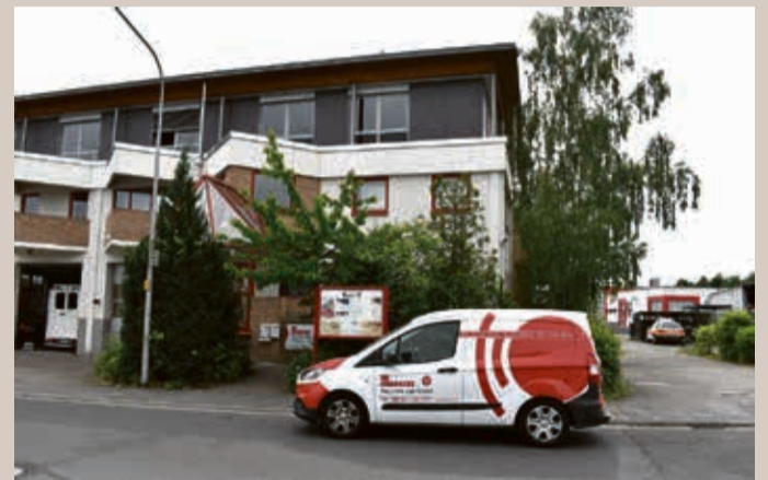
Die Johanniter-Unfallhilfe in Nieder-Roden mit Qualitäts-Fenstern mit Wärmeschutzglas.

Qualitäts-Fenster. Um eine maximale Dämmleistung zu erreichen, sind die Systeme von Sommer Fenster mit 3-fach Wärmeschutz. Verglasung inzwischen mehr denn je gefragt. Bei Sommer Fenster informiert man gerne über alle technischen Details der modernen Fenster- und Türe Systeme und hilft Ihnen dabei, die optimale Lösung für Ihre individuellen Anforderungen zu finden. Auch die notwendigen baulichen Maßnahmen bei Sanierungsvorhaben geht man Schritt für Schritt mit Ihnen durch, sodass Sie genau wissen, was auf Sie zukommt.