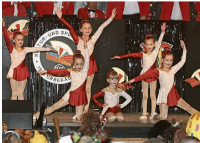
Viel Spaß hatten die Tanzgruppen des KSV bei ihren Auftritten.